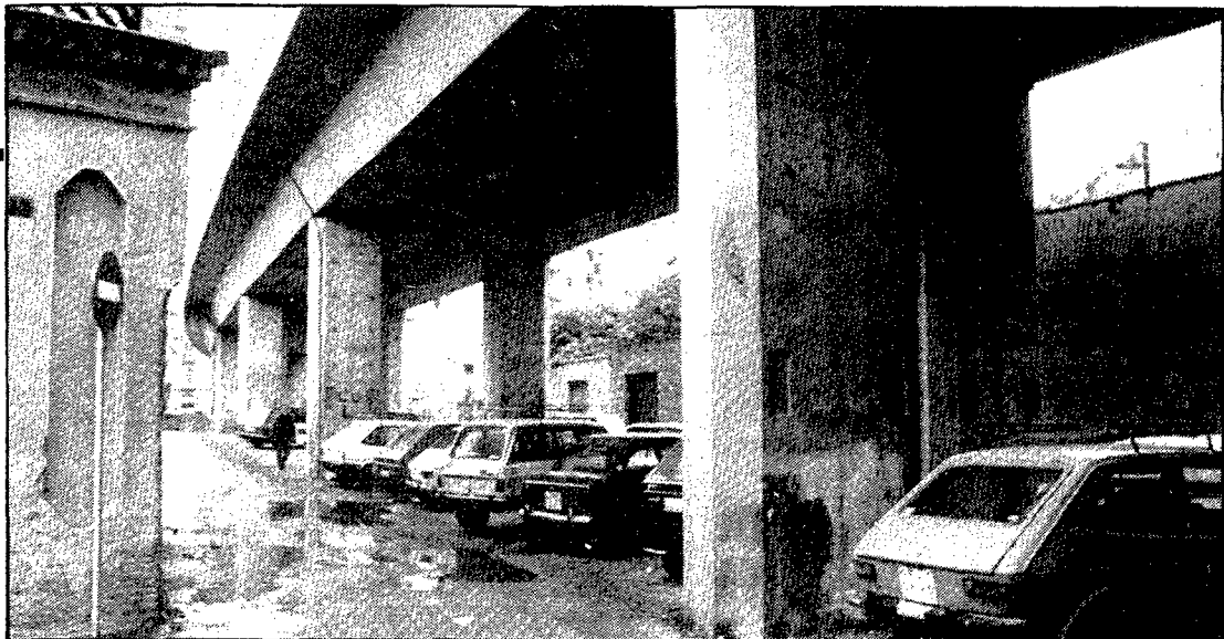
Una imatge del carrer d'en Tomàs Mieres

El carrer d'en Tomàs Mieres s'estén entre la ronda d'en Ferran Puig i la carretera de Santa Eugènia, i és travessat pel bell mig, de punta a punta, pel pas elevat del tren. A mig camí connecta amb el carrer del Porvenir, al qual havia pertangut fins a l'any 1930, quan se'n segregà aquest tram que estem historiant.