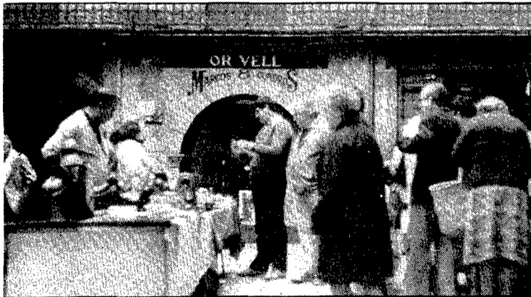
A la plaça de les Castanyes es fa periòdicament un mercat d'antiquitats.

Com ja hem comentat, el sector més ampli i concorregut d'aquest carrer ha estat conegut tradicionalment amb el nom de plaça de les Castanyes, en record del mercat d'aquest producte que s'hi celebrava des de molt antic. És una mena de plaça quadrangular, amb sis entrades distintes, i envoltada de cases de tres pisos d'alçada amb comerços de queviures, bugaderia, farmàcia i artesanía de quadres i marcs artístics. El paviment és enllosat i el fet de ser obert al trànsit rodat trenca l'equilibri i tranquil·litat de l'indret.