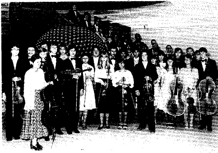
L'orquestra Estudiantil de Praga, «un conjunt amateur, extraordinàriament bo, del nivell del qual no s'averkonyiria cap professional»

internacional. En aquesta contesa hi ajudà el fet que aconseguí el premi «Joventut Musical» insituït per la UNESCO, el «Gran Premi de la Ciutat de París» i el títol «Lauréat de Jeunes Musicales 1980». A partir d'aleshores les actuacions a l'estranger se succeïren ràpidament, sobretot d'ençà que, l'any 1981, aconseguí el primer premi del