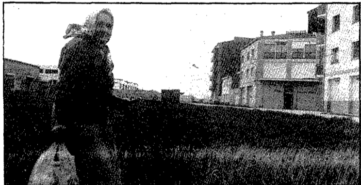
Al costat del passeig d'Olot, un carrer gairebé enmig de camps.