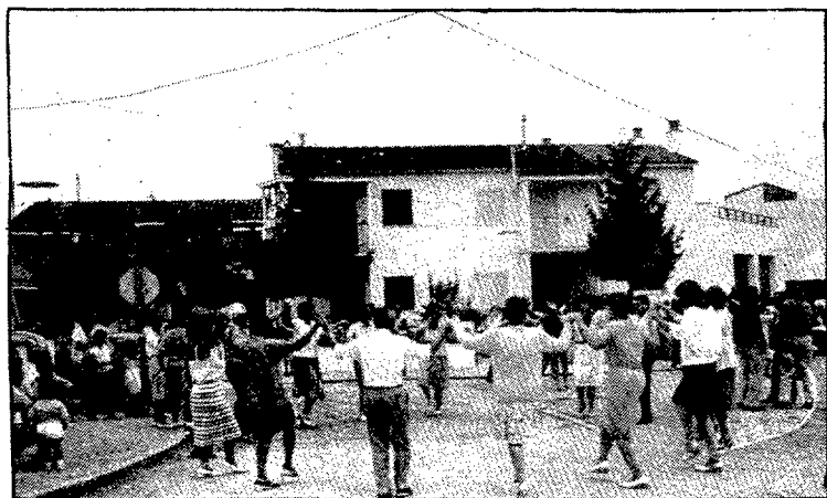
Les cases de la Grober es van incorporar l'any passat a la festa major del barri servint d'escenari a una ballada de sardanes.

Aquesta breu descripció cronològica deixa prou clar el caràcter de zona de serveis que presideix l'avinguda Montilivi. Caldria afegir-hi encara el col·legi menor Bisbe Cartañà i el pavelló esportiu de Sant Josep, dels quals no parlarem aquí perquè tenen l'entrada per altres carrers i perquè si bé en el seu origen donaven per algun dels seus costats a l'avinguda de Montilivi, avui el tros de l'antic camí en el qual foren construïts pertany a un altre vial a mig fer que porta el nom de Lluís Pericot.