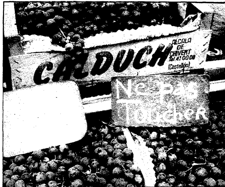
La Unió de Botiguers de Girona es queixa que no s'actua contra els llocs de venda il·legals.

Segons la Unió de Botiguers, aquest passar tothom pel mateix forat «no s'està donant en els casos que denunciem», com ara en la venda il·legal de fruites i