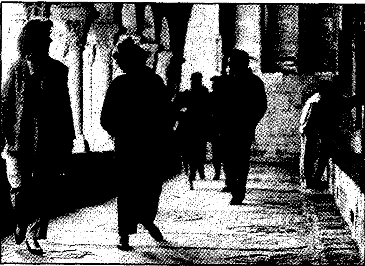
La delegació de Reggio Emilia va visitar, ahir a la tarda, la Catedral de Girona.

GIRONA (De la nostra Redacció). — Des de diumenge es troba a Girona una delegació d'ensenyants de la ciutat italiana de Reggio Emilia, per tal d'establir contactes i intercanviar experiències amb la realitat educativa de la ciutat de Girona. Aquesta visita, que s'allargarà fins dissabte vinent respon a la que una delegació gironina va fer a Reggio el mes de novembre del 1983. Els 13 integrants de la delegació italiana van ser rebuts ahir a l'ajuntament, més tard als serveis territorials i, ja a la tarda, van visitar el barri vell. En la seva estada a Girona faran visites constants a les escoles per contactar amb la realitat educativa de la ciutat, i realitzaran debats i taules rodones sobre aquest tema.