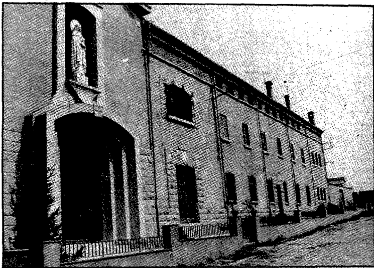
El convent de les carmelites, inaugurat el 1958