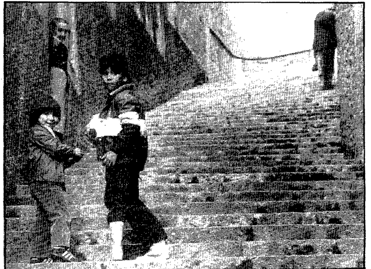
Un carrer que és un laberint d'escales.