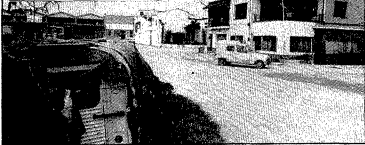
Un carrer en el límit entre la zona industrial de Palau i la urbanització Girona-2