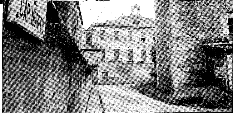
A la dreta, Can Ninetes; al fons, la fàbrica.

En el ple municipal del dia 8 d'octubre del 1965, en el qual s'aprovaren noves denominacions de carrers per als municipis agregats de Santa Eugènia, Palau i Sant Daniel, s'acordà designar amb el nom de carrer Norfeu el que «partiendo de la calle Mayor conduce a la calle de Abajo, paralelamente a la calle de Oriente y a la Travesía de la Fábrica».