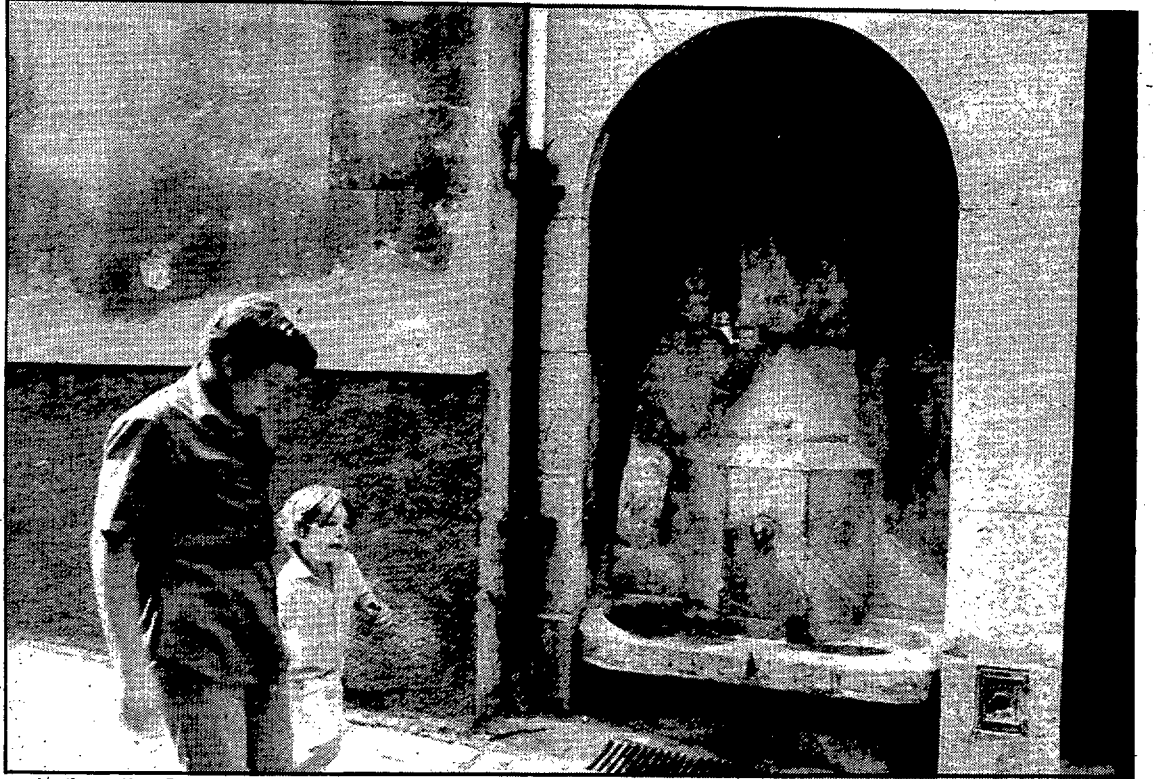
La font d'en Roca és un dels elements més personalitzadors del carrer Nou del Teatre.