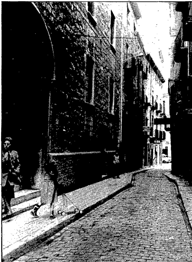
L'església del Mercadal presideix el carrer, i li ha donat nom.