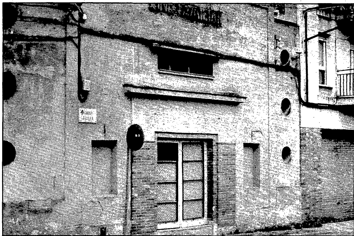
El cine Familiar, a la cantonada del Taquígraf Martí, va fer la seva última sessió el 30 d'abril del 1972.

A la mateixa cantonada, però a la part de muntanya, hi ha una fàbrica de ceràmica industrial, ja tancada. A la paret que dona al carrer de l'Olivera i al camp de Vista Alegre hi ha encastat un relleu de ceràmica dels que produïa la fàbrica, amb la cara de la