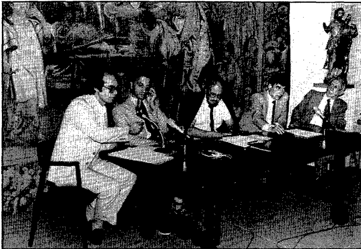
Taula rodona celebrada ahir a la tarda amb tècnics de diferents nacionalitats, a la Fontana d'Or.

Aquests reptes són de tipus tècnic i econòmic, de gestió i planificació, de col·laboració entre institucions públiques i privades i també de conscienciació de l'opinió pública. «Es tracta en el fons —afirmà el director general— de trobar una manera ràpida i econòmica de solucionar aquest problema.»