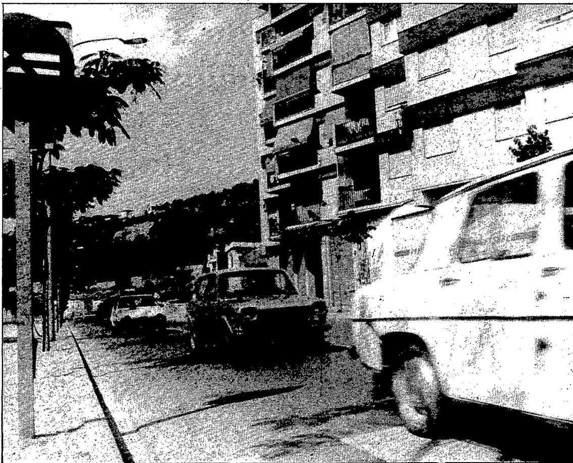
El carrer de Palafrugell segueix linealment el Ter, pràcticament ja al barri de Pedret.

Això fa que al carrer de Palafrugell només s'hi pugui accedir amb cotxe en direcció a Girona, i