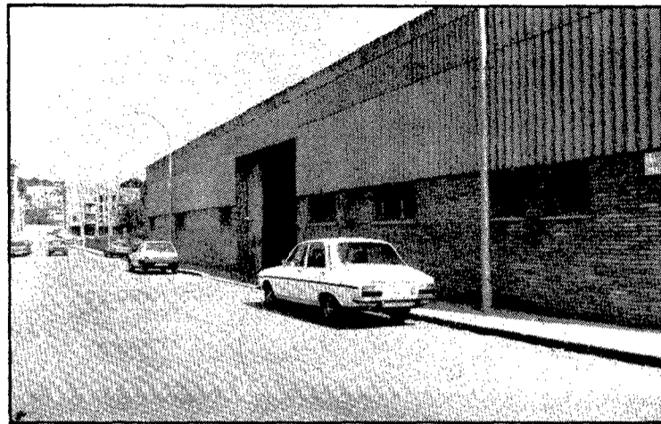
El carrer de la riera Rimau es troba prop dels límits de Girona i Sant Gregori.

L'ajuntament de Sant Gregori va aprovar el projecte d'urbanització el 27 de desembre del 1974, en l'últim ple que va fer abans que es fes efectiva l'annexió a Girona de la part del seu