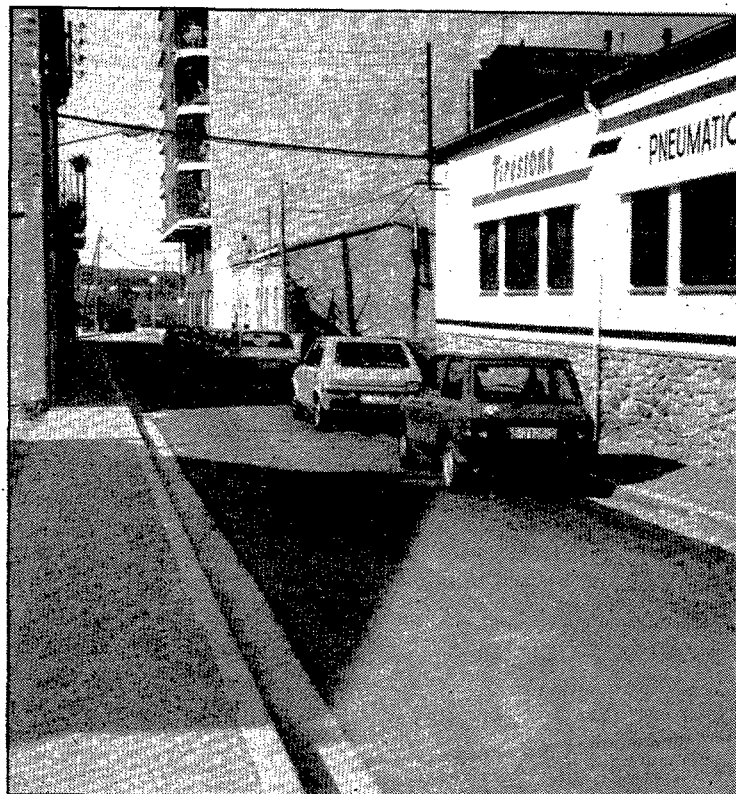
El carrer de Joan Gaspar Roig i Jalpí enllaça el carrer Costabona amb la carretera de Santa Eugènia.

Deixà escrita una obra força extensa que ha estat criticada per la seva manca d'exactitud i precisió, una part de la qual és referida a la ciutat de Girona. Així, podem fer esment de biografies de sants, o bé d'escrits a tall de crònica: «Crònica general del Principado de Cataluña», «Paralipomenon de los Santos de Cataluña», i pel que fa a Girona, destacar per damunt de tot una obra que, malgrat les imprecisions que conté, és encara d'utilitat per als estudiosos. Fou impresa a Barcelona el 1678 i s'intitula «Resumen historial de las grandezas y antigüedades de la ciudad de Gerona, y cosas me-