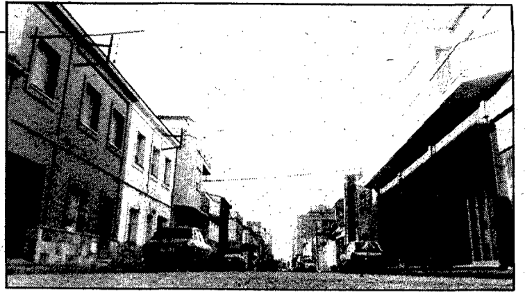
El carrer comença a l'escola Mare de Déu del Mont.