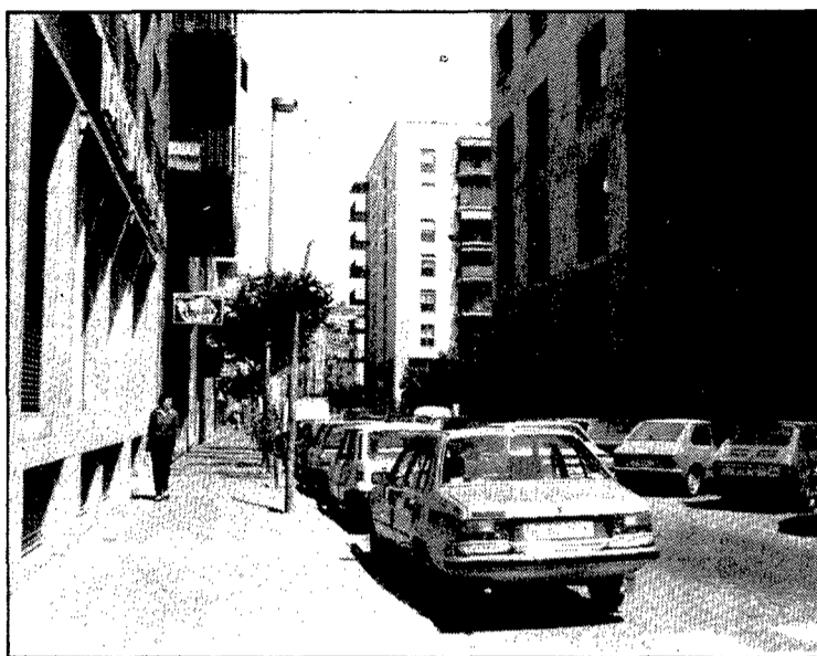
L'avinguda de Sant Francesc, un carrer ben cèntric de Girona.

Força anys més tard, concretament el 1678, el cronista J.G. Roig i Jalpí fa esment de la plaça al·ludint al fet que és habitada per cavallers, amb edificis ben