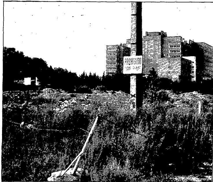
La plaça de Sant Ponç uneix el carrer de l'Esport amb l'aparcament de l'hipermercat.

ocupa el costat de llevant. Hi remetem, doncs, (PUNT DIARI, 15 de novembre i 19 de desembre del 1984), i no cal que hi insistim. Recordem, només que no va haver-hi acord de ple municipal per donar nom a aquesta plaça, ja que l'Ajuntament de Sant Gregori no acostumava a fer-ho. De via decidir-se a començaments de l'any 1973, quan s'acabaven de construir els primers blocs del barri. L'any següent una part de Sant Gregori que incloïa Sant Ponç va ser agregada a Girona i a aquest municipi pertany des d'aleshores.