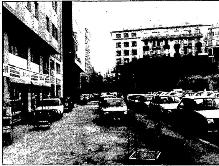
Una imatge actual del carrer de la Sèquia

La sèquia Monar, dita també Rec Comtal, té un origen medieval i es creu que va ser construïda per ordre dels comtes de Bar-