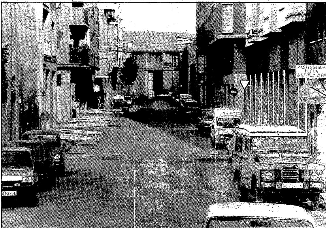
El carrer de Valladolid és un dels vials de l'eixample, del barri de Sant Narcís.

Tot un costat del tros més pròxim a l'avinguda de Sant Narcís és ocupat per la tanca de l'empresa COMEXI, S.A., dedicada a la fabricació de maquinària per a la laminació, impressió i manipulació de plàstics, papers i altres materials complexos, maquinària que exporten a diversos països europeus i americans. L'entrada dels camions que porten i recullen material de l'empresa per una porta de la tanca que do-