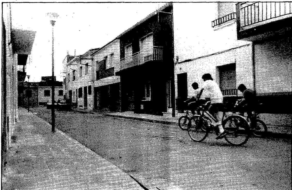
El carrer del Vesuvi es troba situat al polígon Kim, de Taialà.

No hi ha constància de la data exacta en què fou batejat el carrer, ja que, com hem comentat en d'altres ocasions, en aquella època l'ajuntament de Sant Gregori no tenia el costum de prendre un acord de ple i, per tant, no hi ha cap referència als llibres d'actes. Pot dir-se, però, que va ser l'hivern del 1970.