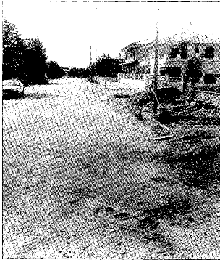
El carrer de la riera Burgantó es troba a la urbanització Mas Abella.