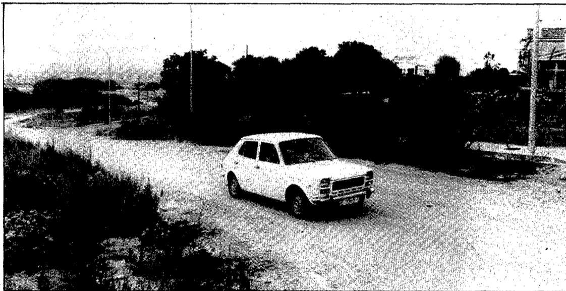
El carrer de Can Prunell forma part de la Urbanització Can Grau de Palau-sacosta.

ple del 19 de juliol del 1985, a petició dels promotors de la urbanització a la qual pertany i al mateix temps que el de molts altres carrers de noves urbanitzacions de la ciutat. Una quinzena