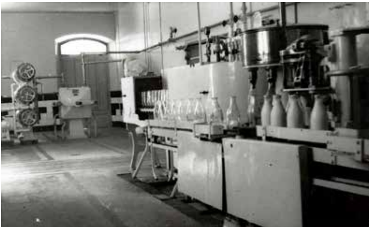
Interior de la Central Lletera situada al carrer d'en Jeroni Real de Fontclara.

Catalunya i, també, impulsor de la Lliga Regionalista. Per altra banda, en la sessió del 4 d'abril havia quedat aprovada i constituïda la Comissió Especial d'Estudi per agregació de terrenys de termes municipals veïns, una comissió, encarregada d'estudiar l'eixamplament del municipi de Girona, que fou presidida per un alcalde que estava decidit a dotar de qualitat el subministrament de llet a la ciutat. Per això, en la ja al·ludida sessió del 4 de juliol, el saló de plens va acollir la discussió del Reglament de Policia Sanitària per al proveïment de llet higiènica. El projecte de creació d'una central lletera s'estava gestant, però no s'acabaria de concretar, un cop superats molts debats i moltes discussions, fins després del mes d'octubre.