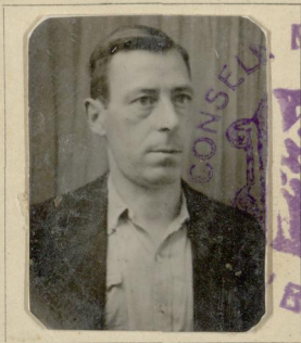
Signatura de l'interessat

Decret Conselleria Treball i Obres Públiques Generalitat 16 juny 1937.