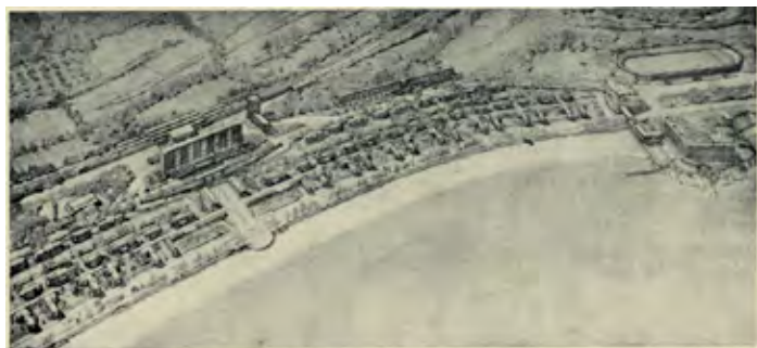
Figura 7. Recreació del Poblats d'Estiueig (1929).

adaptar-se a les noves realitats socials. En aquest sentit, el litoral gironí, la Costa Brava, ha estat un excel·lent laboratori per a l'estudi de totes aquestes pràctiques, ja que ha comptat amb una concentració i projecció úniques que l'han catapultat com un destí únic a la Mediterrània.