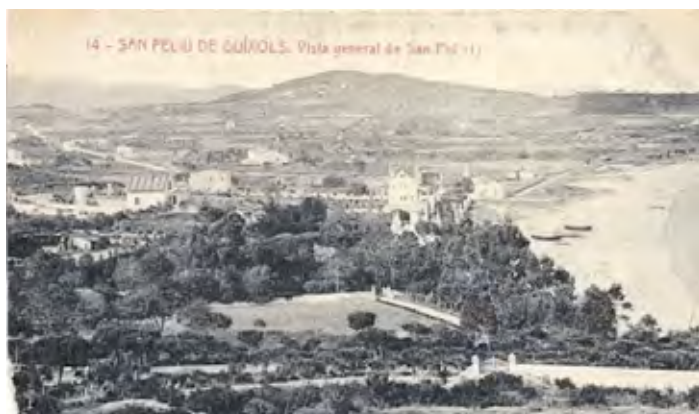
Figura 2. Platja de Sant Pol, Sant Feliu de Guíxols (1900-1920).