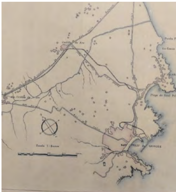
Figura 3. Litoral de la Vall d'Aro (1923).