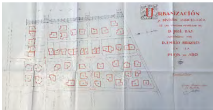
Figura 5: Plànol del projecte de Josep Esteve Corredor (1928).

Cal apuntar que, malgrat l'execució parcial d'aquest projecte, l'esclat del turisme de masses a partir de la dècada de 1960 i la urbanització del front marítim, va propiciar la progressiva desaparició de la trama original i de la relació